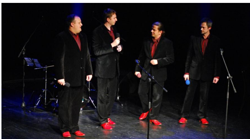
Złoty Liść Retro '2008